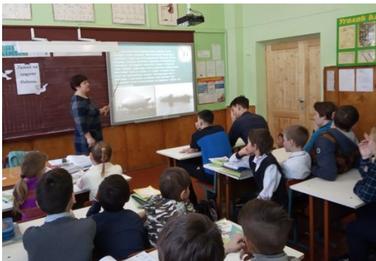
Письмо и подарки солдату